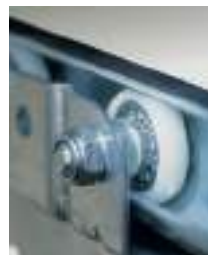
Galet nylon et roulement à billes