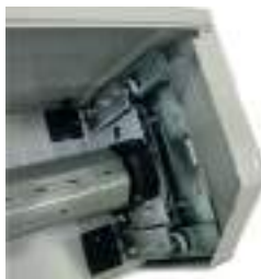
Console à translation

L'axe d'enroulement est monté sur console à translation et apporte à « Hawai 77 Plus » une extraordinaire souplesse de fonctionnement.